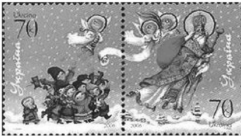
«Снігом, снігом та льодами, Гей, здалека йде в наш край, Йде з гостинцями, дарами...». Поштова марка з нагоди Дня Святого Миколая – 19 грудня

Образ святого Миколая можна зустріти майже в усіх православних родинях. Перед ним віруюча людина молилася про допомогу в усіх більш-менш важких обставинах свого життя: «Немає на нас поборника проти Миколи», «Попрочи Микола, і він скаже Спасові».