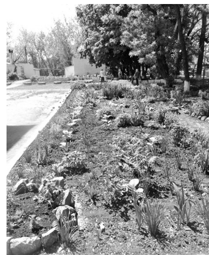
Верхівцевська СЗШ № 1