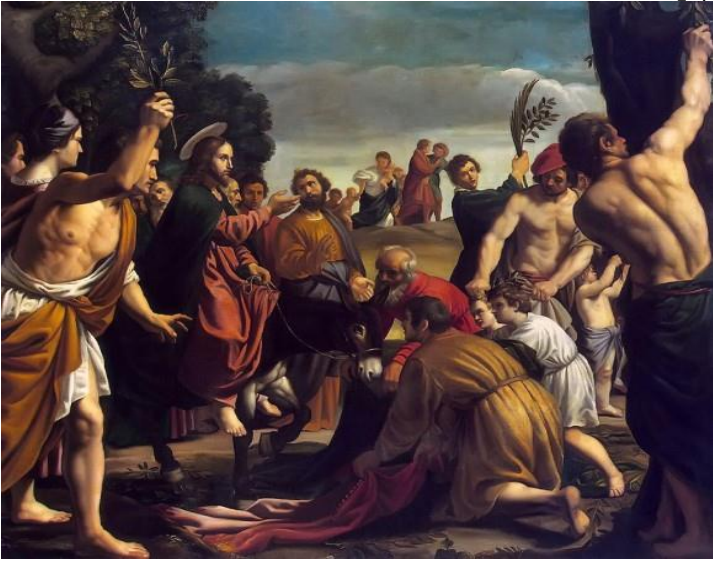
Вхід Господній в Єрусалим. Педро Орренте