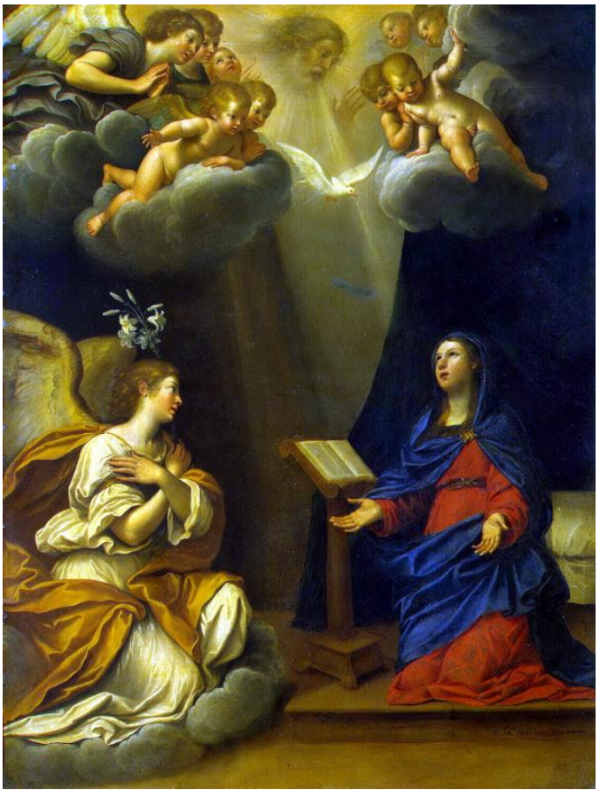
Благовіщення Альбані Франческо