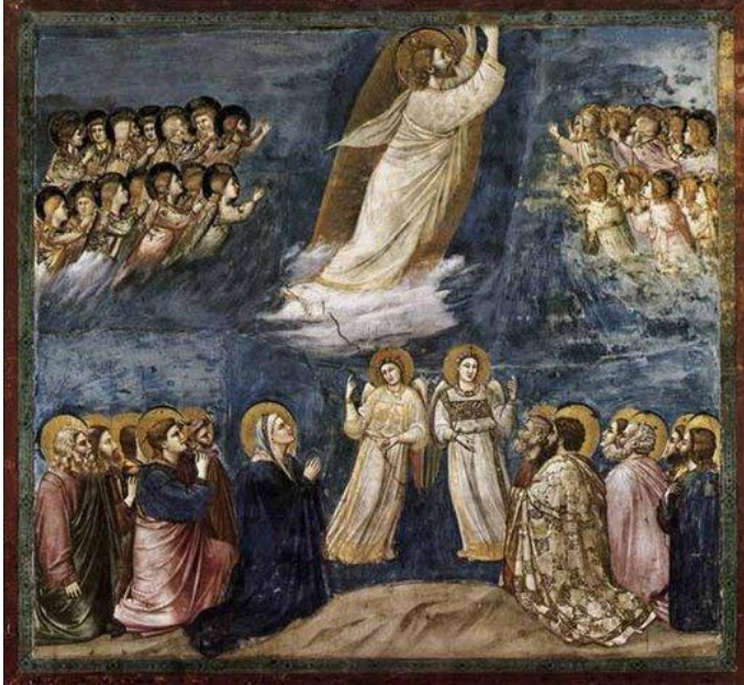
Вознесіння Господнє. Джотто ді Бондоне.