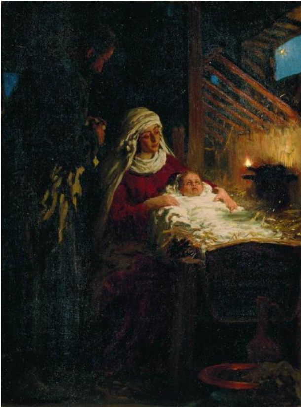
Різдво Христове Ілля Репін

Вчитель називає головні християнські свята і на екрані демонструються картини художників або образи на тему даного свята. Учитель разом з учням пригадує зміст свят.