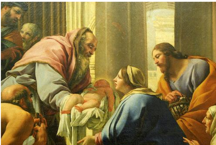
Стрітення. Симон Бує