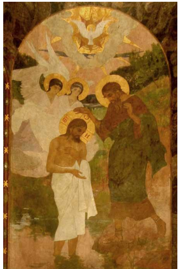
Хрещення Господнє. Києво-Печерська лавра