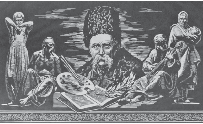
У Дніпропетровському художньому музеї з нагоди 202-ї річниці від дня народження Тараса Шевченка стартує проект