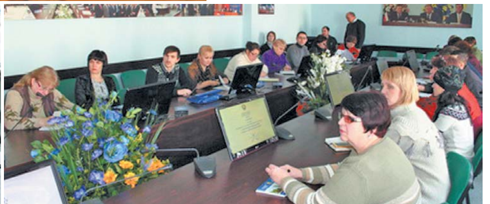
За інформацією оргкомітетів Всеукраїнських учнівських олімпіад