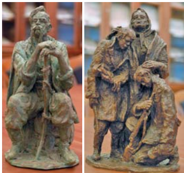
«Запорожець» та «Благословення». З колекції Острозької академії.

ЗАСНОВНИК ОБЛАСНОЇ ПЕДАГОГІЧНОЇ ГАЗЕТИ «ДЖЕРЕЛО» — ДЕПАРТАМЕНТ ОСВІТИ І НАУКИ ОБЛДЕРЖАДМІНІСТРАЦІЇ