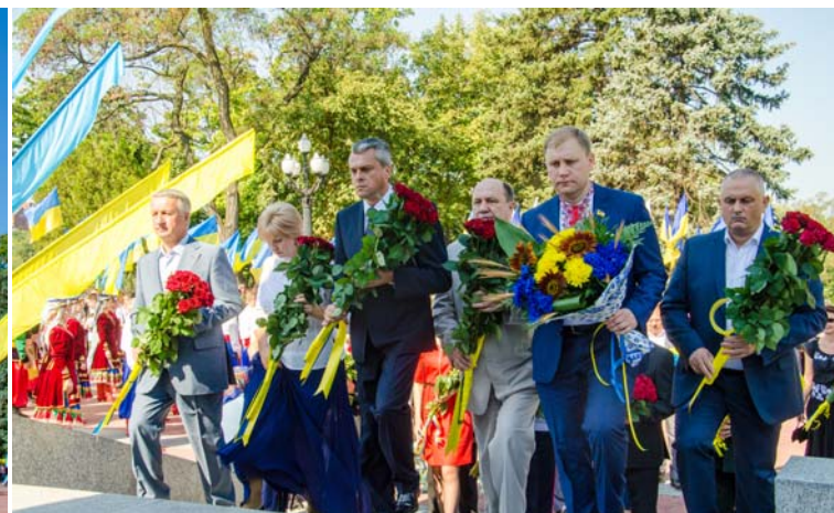
За матеріалами департаменту інформаційної діяльності та комунікацій з громадськістю облдержадміністрації