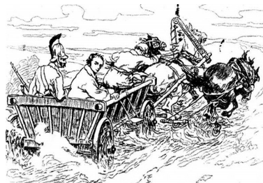
М. Самокиш. Шевченка везуть на заслання

Лунає пісня на слова Т. Шевченка «Думи мої, думи мої», одночасно на мультимедійному екрані з'являються репродукції картин про перебування поета в засланні/.