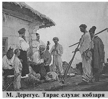
М. Дергус. Тарас слухає кобзаря