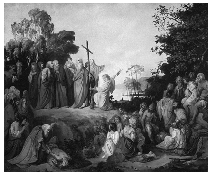
Апостол Андрій Первозваний водружає хрест на горах Київських. Микола Ломтєв. 1848 р.

Різними середньовічними джерелами повідомляють про подальший шлях святого Андрія до Новгорода, де він спорудив хрест біля нинішнього села Грузино на березі Волхова, потім відправився до Ладозького озера і далі – до острова Валаам, де встановив кам'яний хрест і винищив капища богів