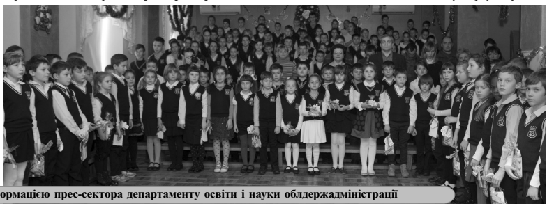
За інформацією прес-сектора департаменту освіти і науки облдержадміністрації

Учні підготували «кіборгам» концерт, під час якого склали велику карту України.