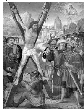
Апостол Андрій Первозваний. Початок XVI ст. Британська Бібліотека.

Різними середньовічними джерелами повідомляють про подальший шлях святого Андрія до Новгорода, де він спорудив хрест біля нинішнього села Грузино на березі Волхова, потім відправився до Ладозького озера і далі – до острова Валаам, де встановив кам'яний хрест і винищив капища богів