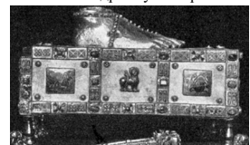
Сандаля та цяха святого Андрія у Трирському соборі

За легендою, у VIII столітті мощі апостола Андрія були перевезені