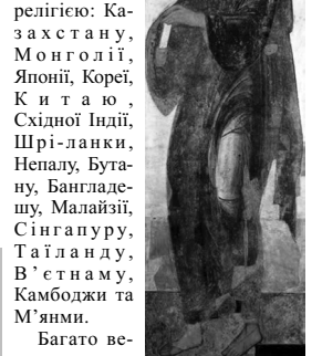
Апостол Андрій Первозаний. Андрій Рубльов, Данило Чорний та майстерня, 1408 р.

Багато великих живописців присвячували свої полотна зображенням святого Андрія, зокрема Хосе де Рибера, Ель Греко, Сурбаран тощо.