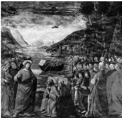
Покликання Апостолів Петра та Андрія. Доменіко Гирландайо. 1481 р. Ватикан. Сикстинська капела.