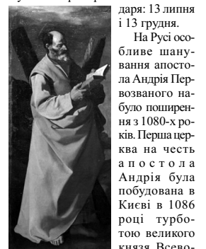
Святий Апостол Андрій. Франсиско де Сурбаран. 1632 р.

Апостол Андрія вважають своїм святим покровителем християни України, Росії, Шотландії, Румунії, Греції, Сіцилії, а також тих країн, де християнство не є поширеною релігією: Казахстану, Монголії, Японії, Кореї, Китаю, Східної Індії, Шрі-ланки, Непалу, Бутану, Бангладешу, Малайзії, Сінгапуру, Таїланду, В'єтнаму, Камбоджі та М'янми.